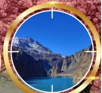
GUPIS ATTABAD LAKE